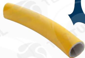
Cross section PE-AL-PE pipe